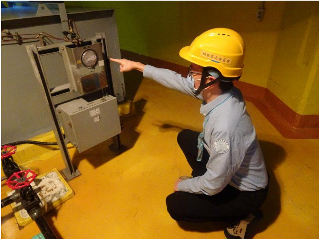
核安會視察員查核 2 號機輔機廠房設備狀況