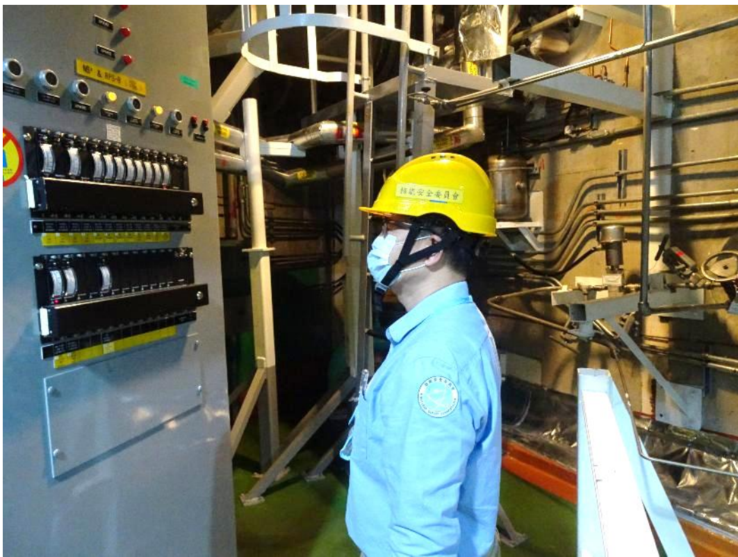
核安會視察員查核1號機輔機廠房設備狀況