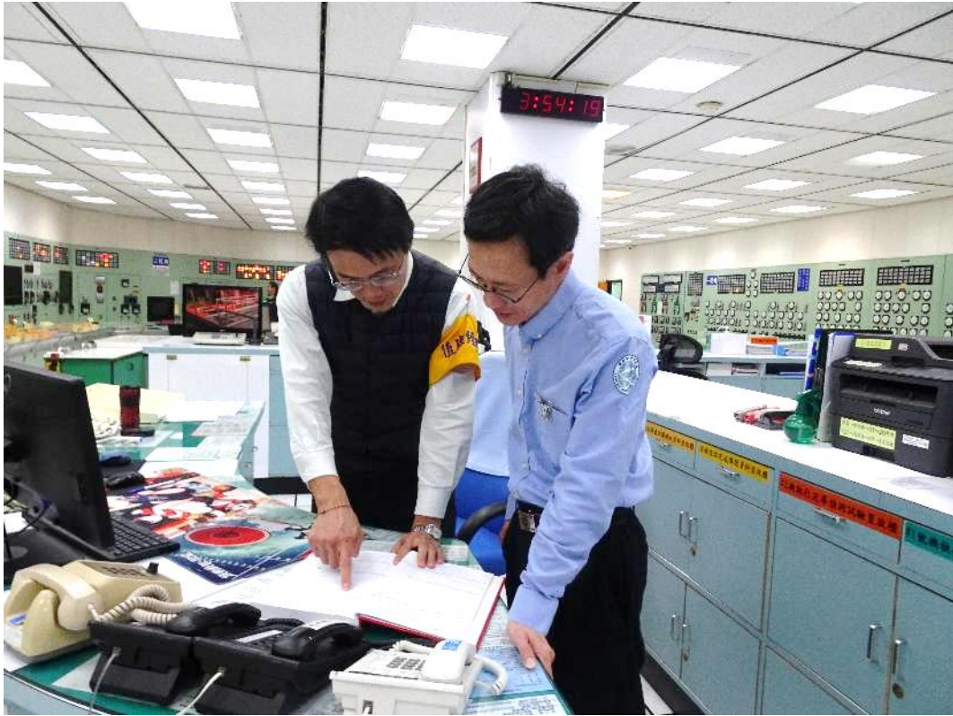
核安會視察員查核主控制室機組狀況