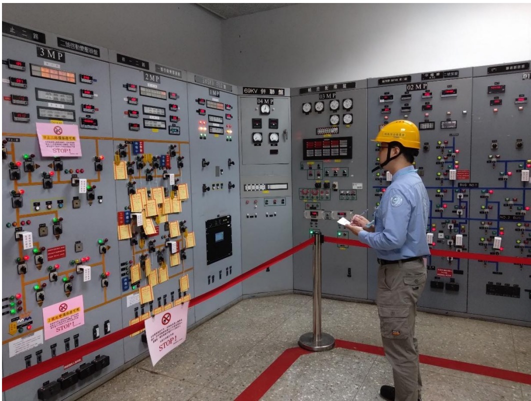
核安會視察員查核開關場控制室狀況