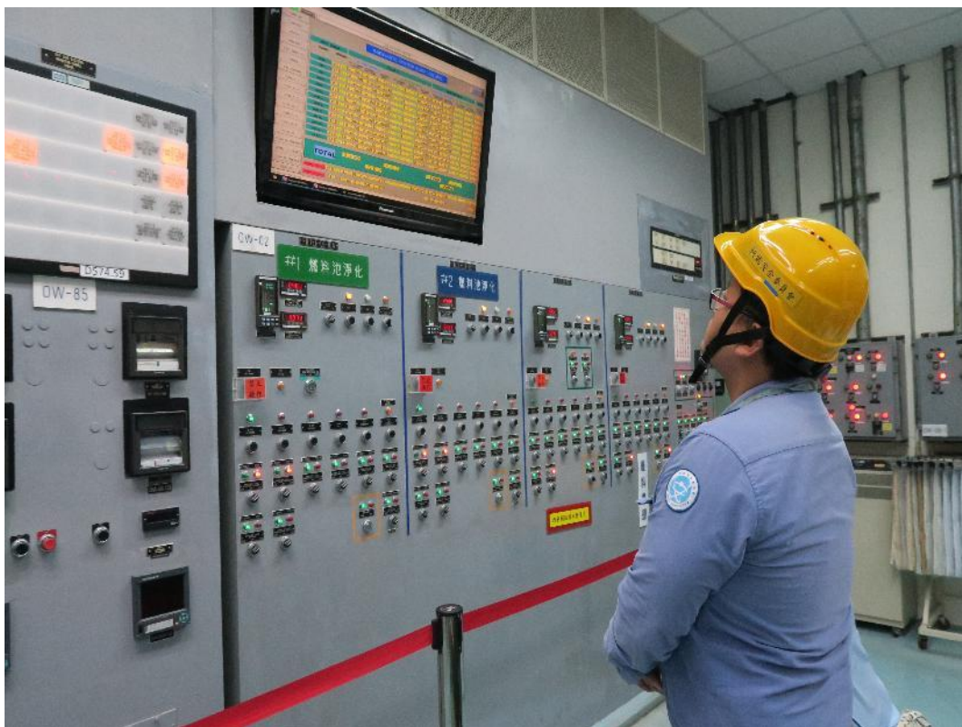
核安會視察員查核廢料廠房控制室運轉狀況