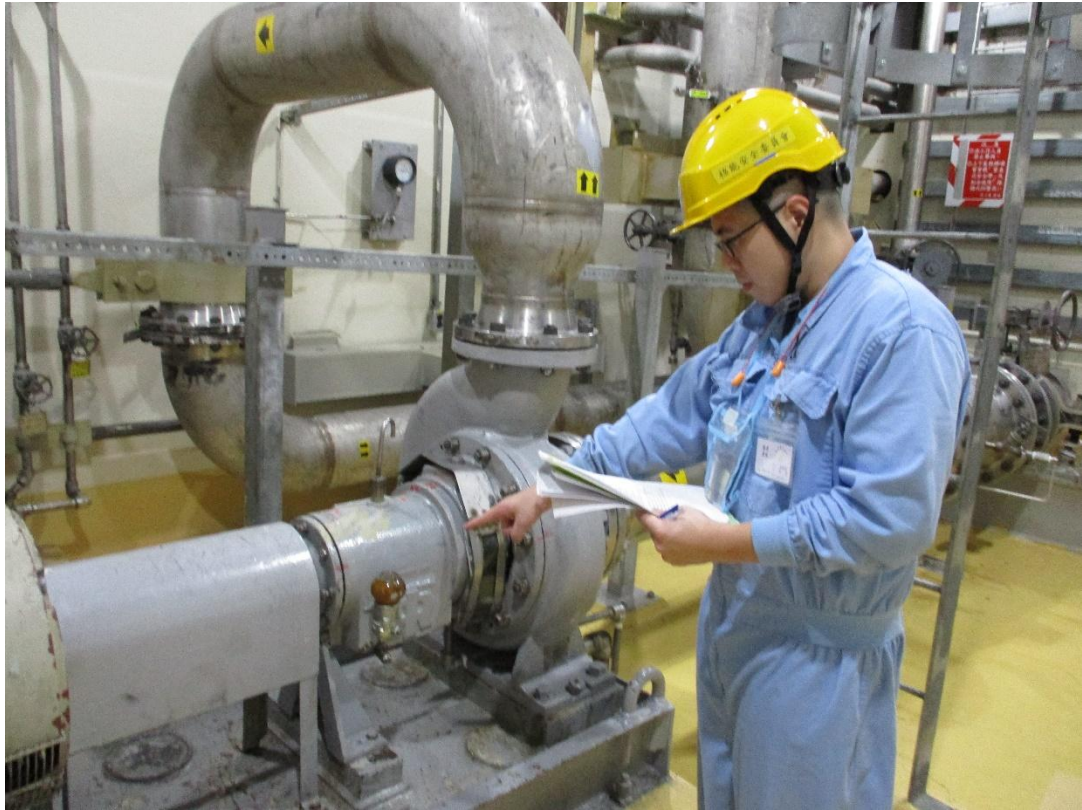
核安會視察員查核 2 號機輔助廠房現場狀況