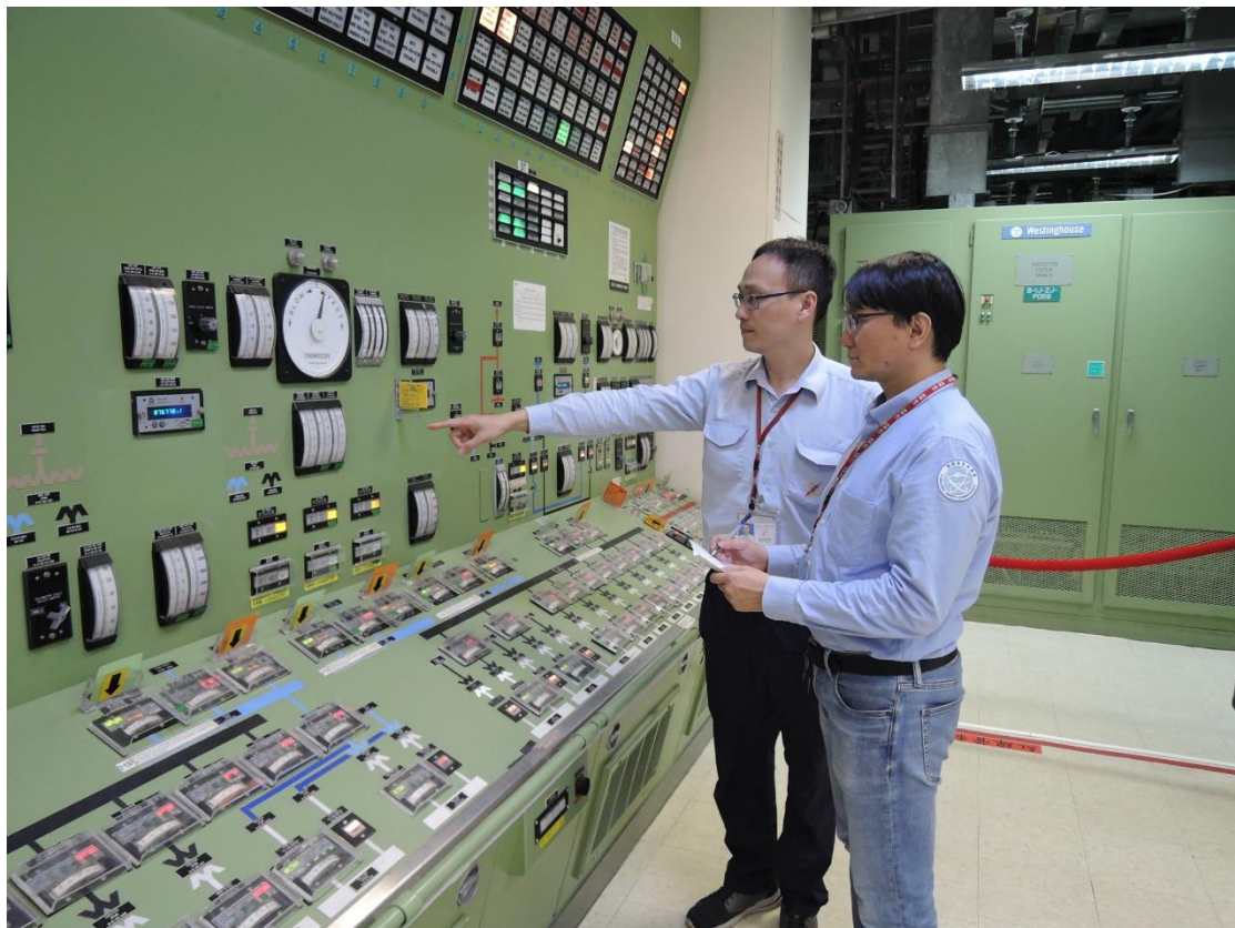
核安會視察員查核1號機主控制室機組狀況