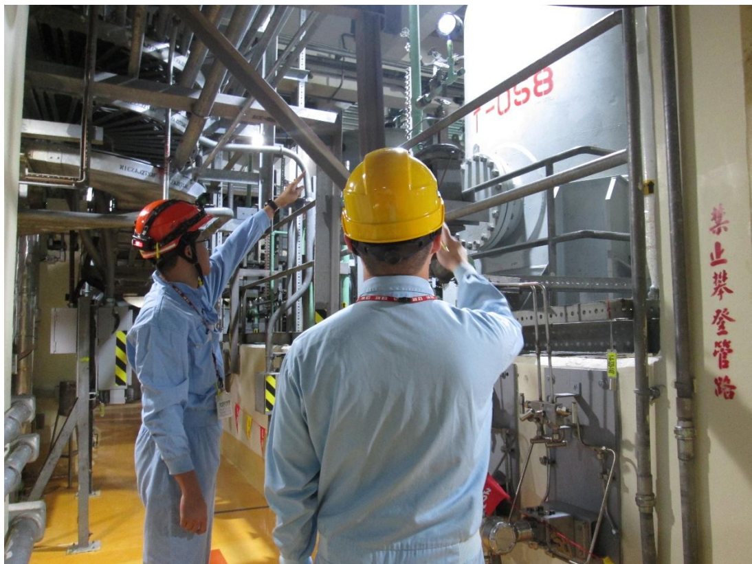
核安會視察員查核 1 號機輔助廠房現場狀況