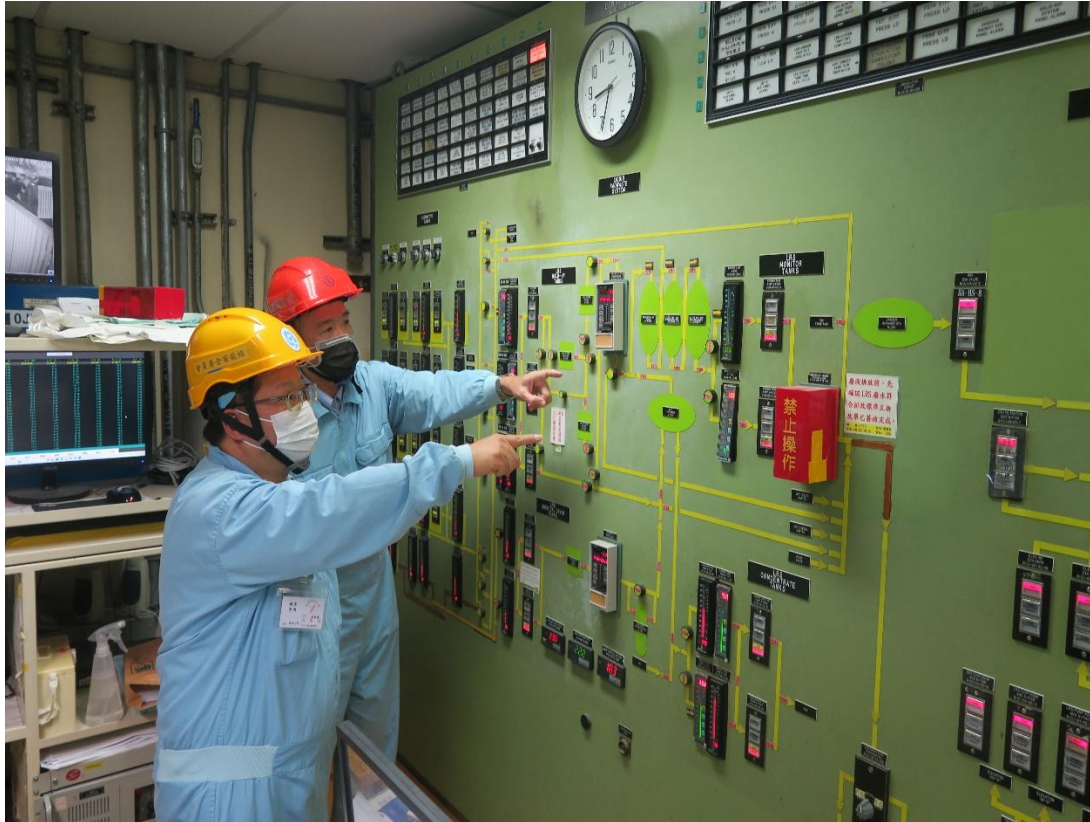
核安會視察員查核廢料廠房控制室狀況