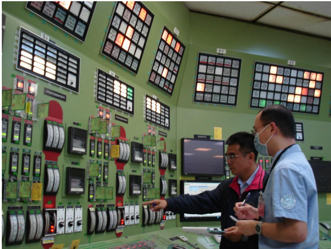
核安會視察員查核 2 號機主控制室機組狀況