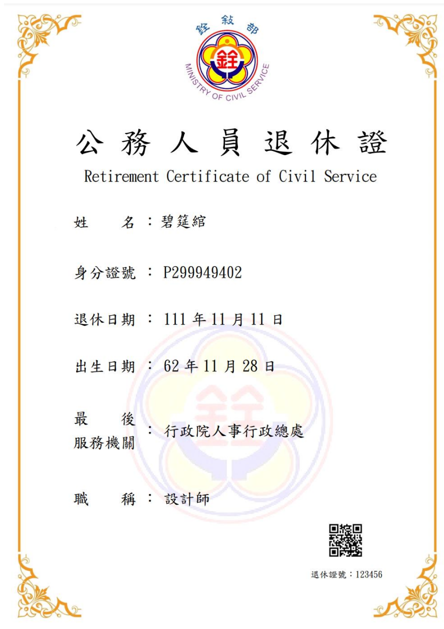
圖 8 公務人員退休證測試圖樣(範例)