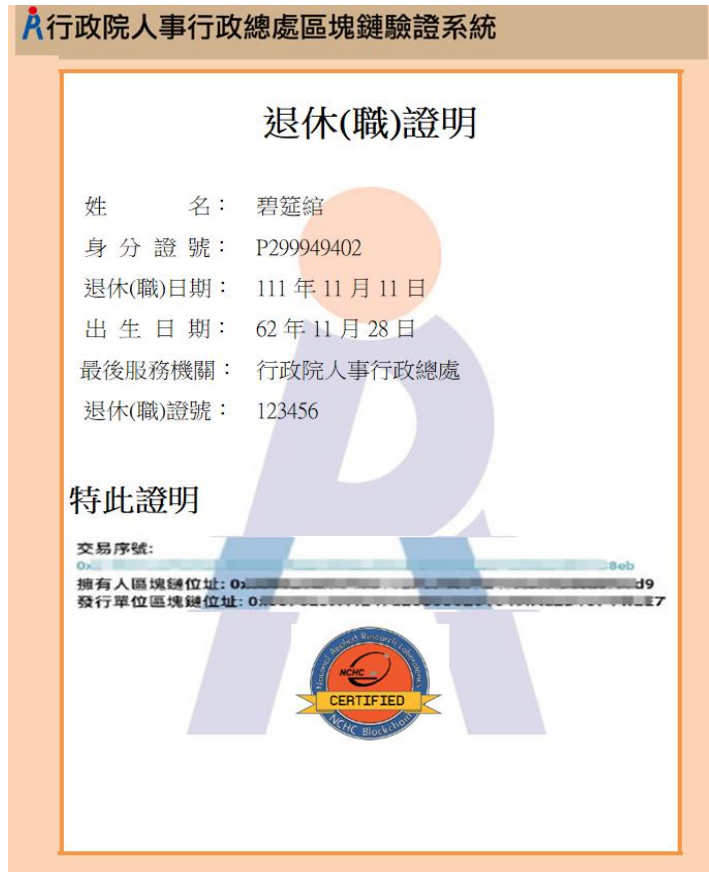
圖 10 區塊鏈驗證測試圖樣(範例)