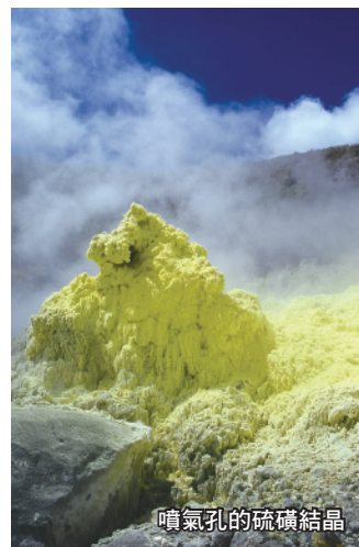
噴氣孔的硫磺結晶

位於台北盆地北緣的陽明山國家公園，面積約11,455公頃，是台灣除了龜山島以外的主要火山分布地區。將時間回溯到280萬年前，此處原始的火山開始第一階段的強烈噴發，噴出的火山碎屑岩及安山岩熔岩流開始堆積；到了70萬年前左右，是第二階段火山活動的旺盛時期；而最後的噴發是在大約30萬年前，紗帽山在七星山南側的山腰形成之後，整個火山群的火山噴發活動便趨於停止。