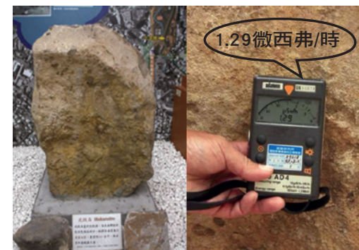
北投溫泉博物館鎮館之寶—北投石，其表面劑量率：1.29微西弗/時。

北投石是1905年間由日本技師岡本要八郎於北投溪中發現，因係世界首次發現，故以產地命名，這也是全球四千多種礫石中，唯一以我國地名命名的礫石。北投石含有微量放射性元素鐳，因意外引起底片曝光才會被發現。