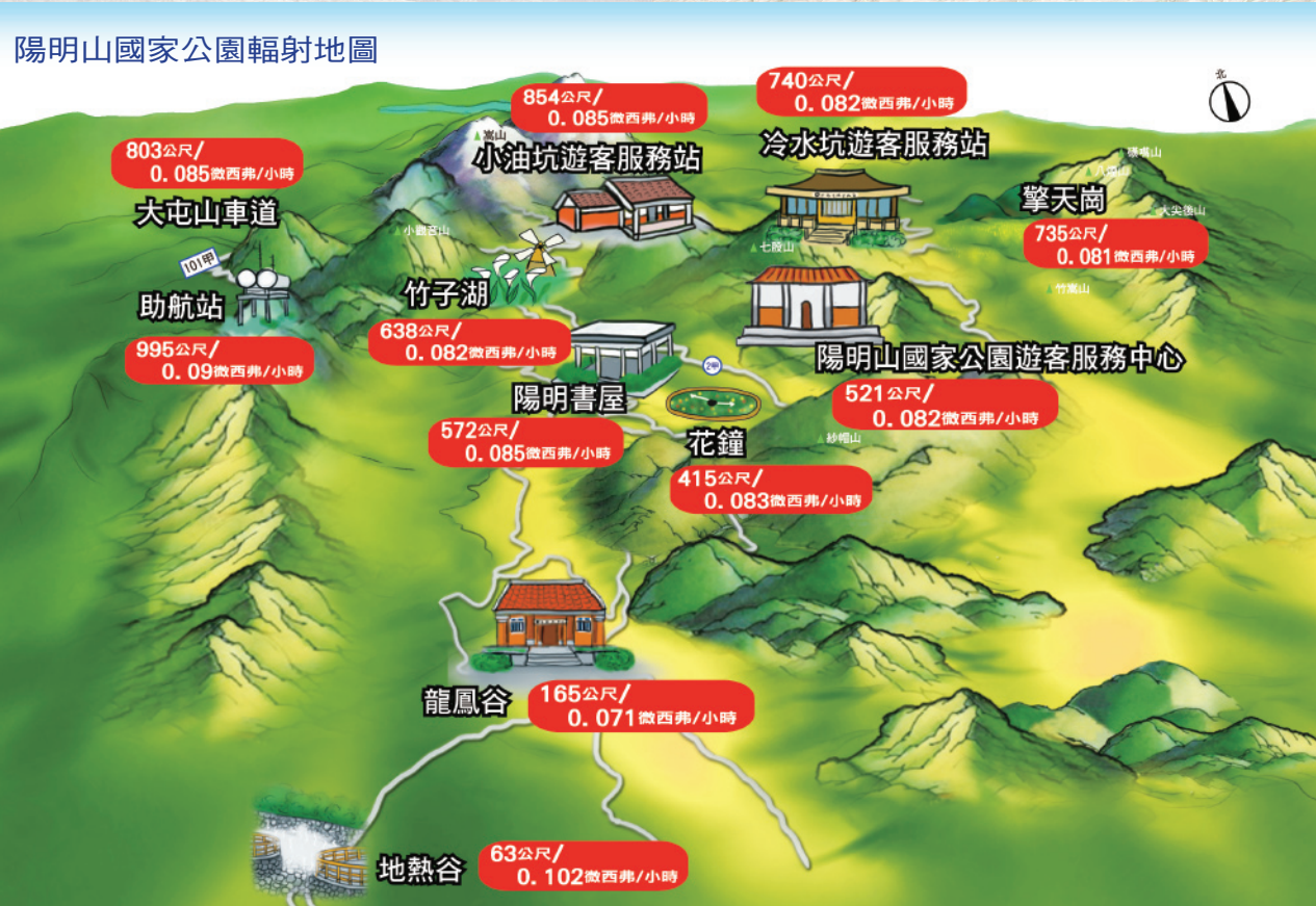
北投、陽明山地區天然背景輻射變化圖

有些溫泉含有微量放射性鐳及氫氣，所以可能造成溫泉露頭處的輻射劑量較一般地區略高，在北投地熱谷的某些特定點之稍高背景輻射即為此因。